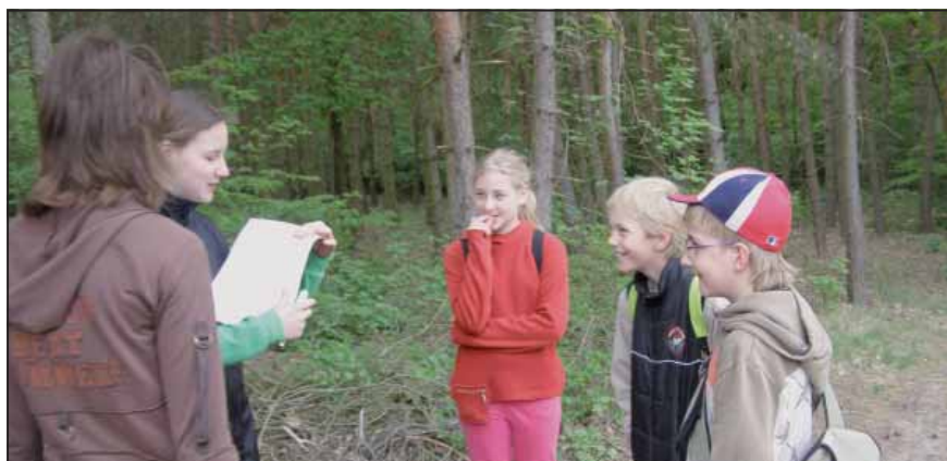
Závod ke Dni Země

• 28.- 29.4. proběhl v Mydlovarském luhu první ročník běžecko-po-