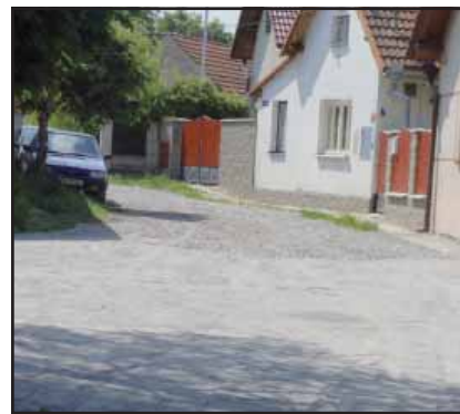
Úprava ulice v Hronětících.

Vážení spoluobčané, v krátkosti jsem Vám nastínila, co nás čeká