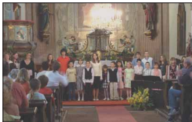
Koncert ZUŠ v kostele.